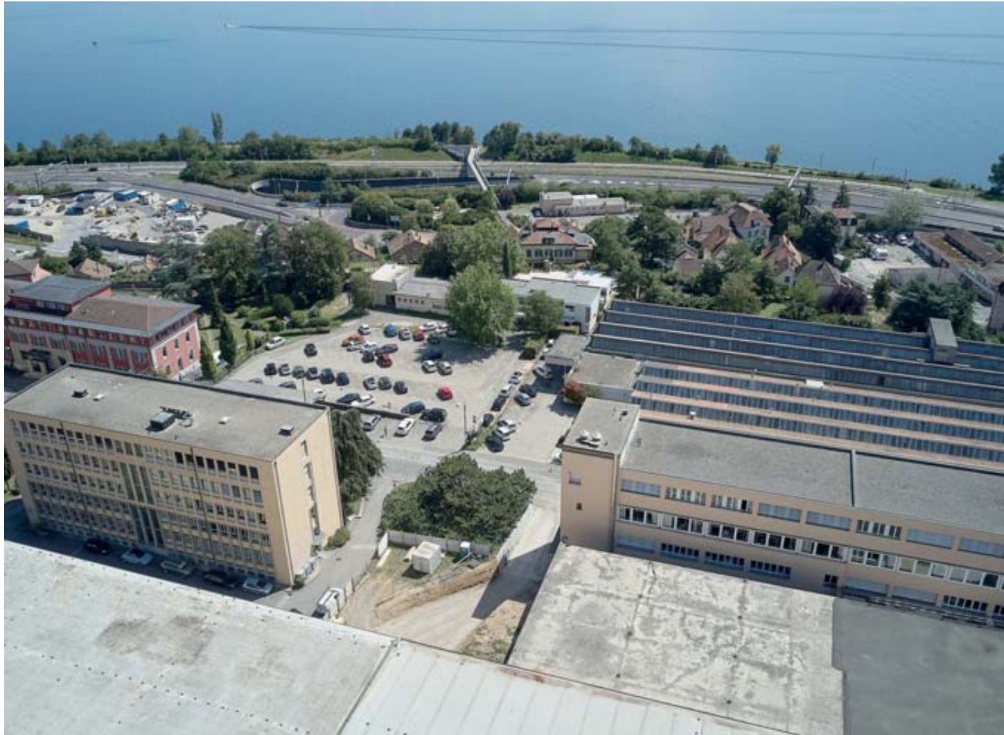
Le grand quartier de Tivoli Sud doit s'ériger sur l'ancienne friche de l'usine Suchard.